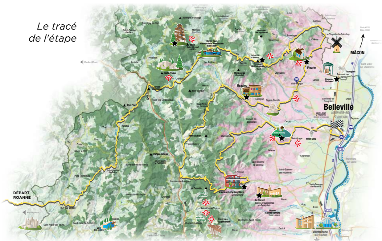
Le tracé de l'étape

prend vie. De quoi donner envie de prendre le guidon sur les boucles cyclo-touristiques de la région librement ou en tours guidés et gravir les Cols de Durbize, de Saint Bonnet ou du Châtoux.